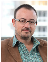
Manuel Martín Cuenca