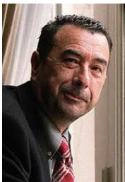
José Luis Garci